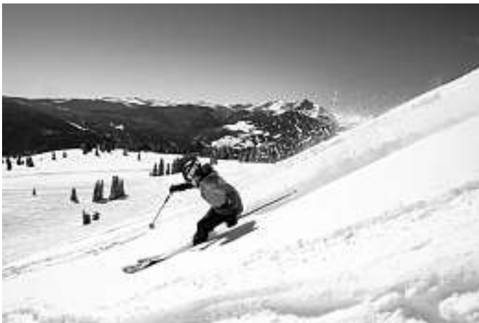
Gemeinsame Tagesskiausfahrt nach Serfaus-Fiss-Ladis

Wir freuen uns auf eine tolle gemeinsame Skiausfahrt. Skiclub Reinerzau x Skiverein Alpirsbach