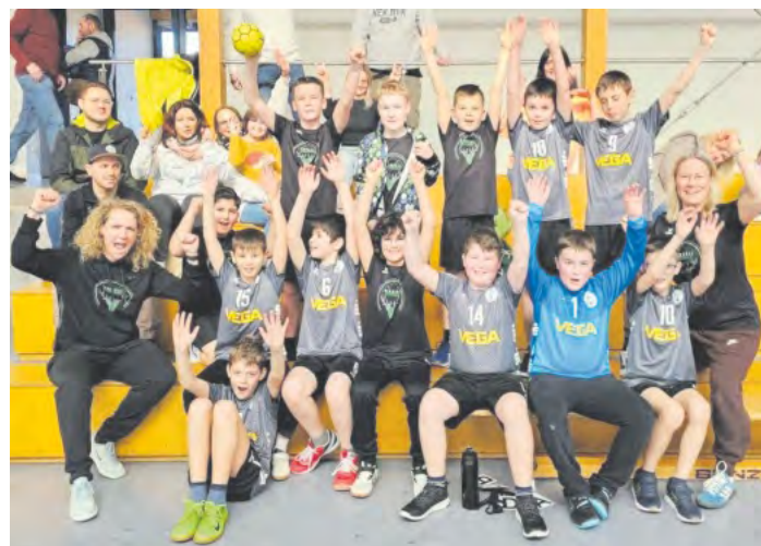
die hochmotivierte E-Jugend